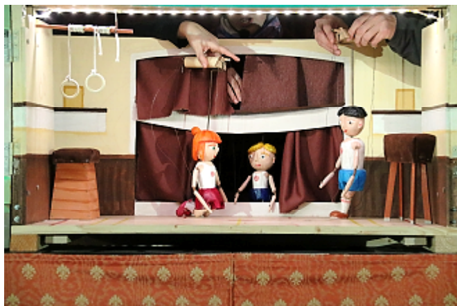
Představení Vánoční Sokol