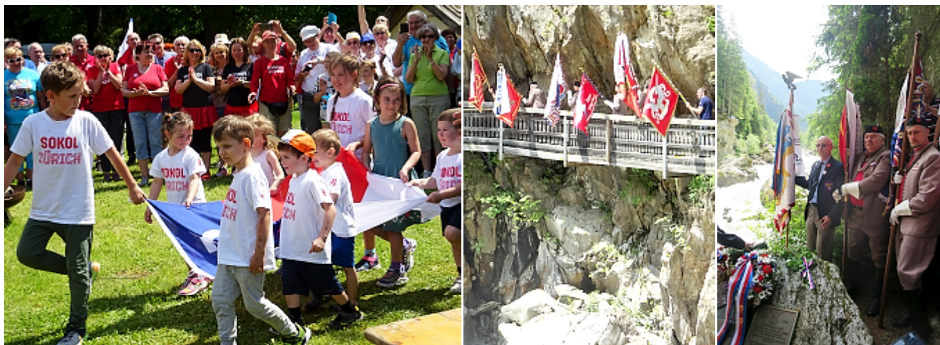
Slavnostní zahájení 48. sokolského setkání v tyrolském Oetzu 27. 5. 2023 a krojovaný sokolský průvod a pietní akt u pomníku Dr. Miroslava Tyrše u řeky Ache 29. 5. 2023.