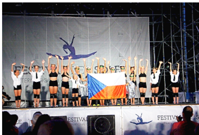
Moderní gymnastky ze Sokola Praha Královské Vinohrady roztleskaly 6. 7. 2023 Arénu Roma na 16. ročníku Festivalu Slunce (Festival del Sole) v italském Riccione.