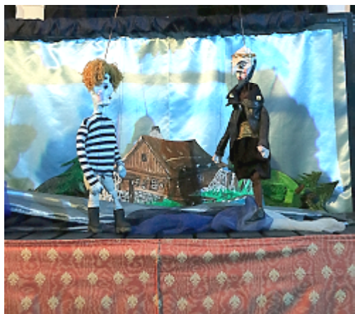
Představení Tři zlaté vlasy