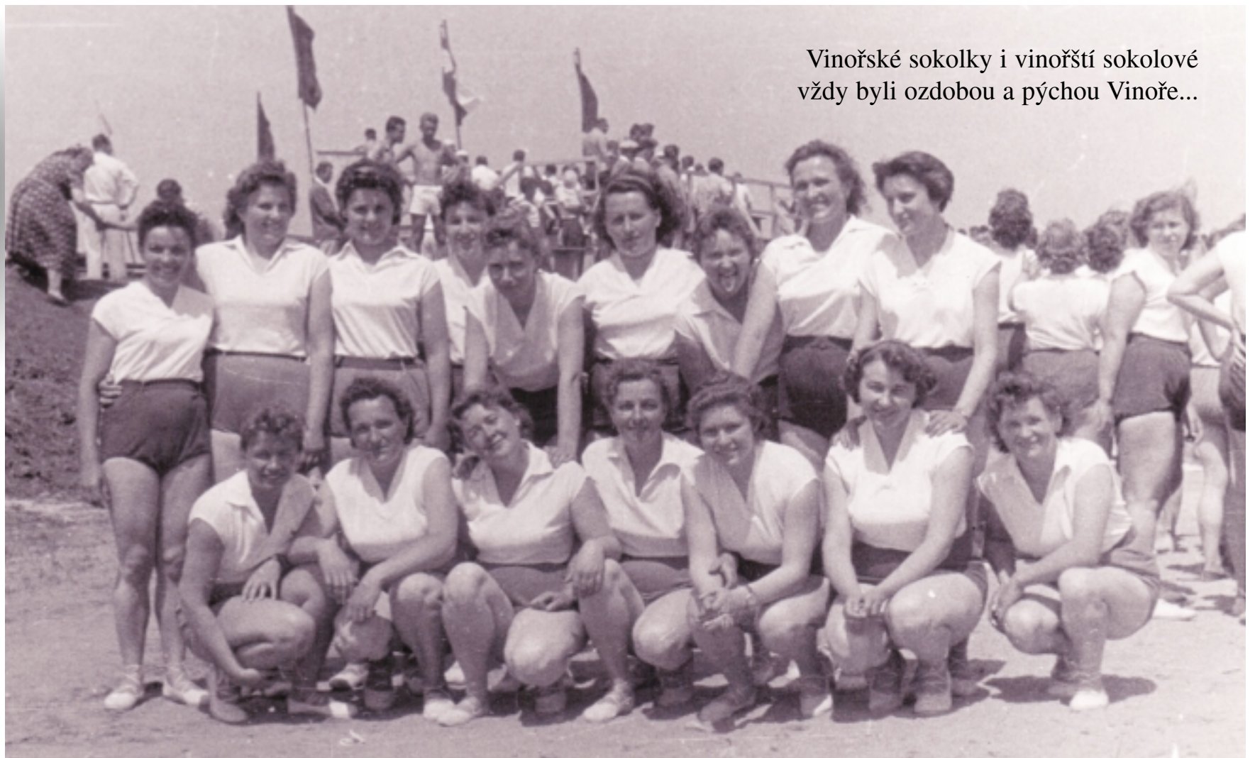
Vinořské sokolky i vinořští sokolové vždy byli ozdobou a pýchou Vinohr... ...