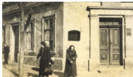
U Řepků – dnes vietnamský obchod