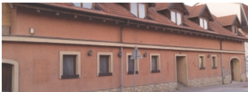
U Trpišovských – dnes bývalá restaurace Pod vinořským zámkem