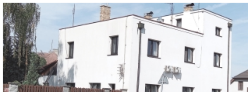
Na Skalce - U Barachovských – dnes rodinný dům