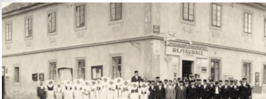
U Karoušků – dnešní restaurace U Černínů